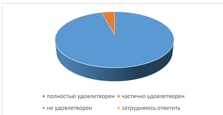
Рисунок 2. Анкетирование (опрос) представителей работодателей по профессии 43.01.09 «Повар, кондитер»