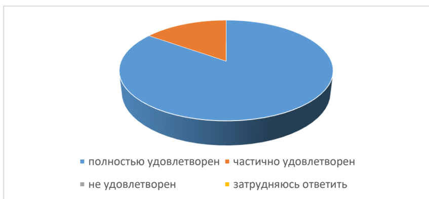
Рисунок 1. Анкетирование (опрос) представителей работодателей по специальности 38.02.03 «Операционная деятельность в логистике»

Проведенное анкетирование (опрос) показало, что по мнению представителей работодателей компетенции выпускников колледжа, сформированные при освоении образовательных программ, полностью или в основном соответствуют профессиональным стандартам. Работодатели полностью или в основном удовлетворены уровнем теоретической и практической подготовки выпускников (рисунок 1, 2, 3, 4).